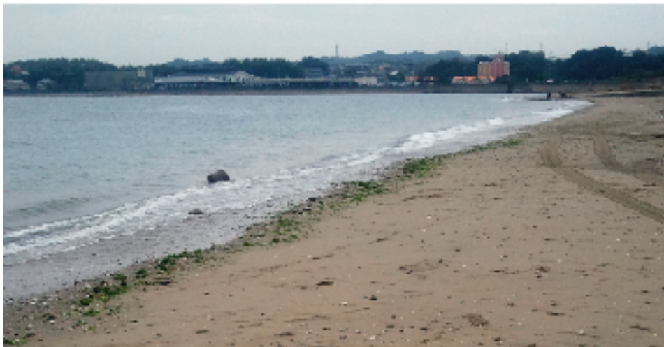
※写真は、当日撮った「魚太郎」近くの浜です。