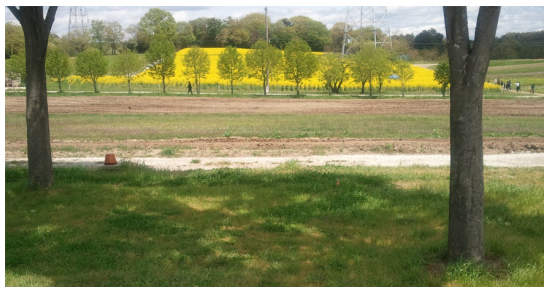
2015年4月愛知牧場にて *遠足でみなさまの写真を撮ることはありません。